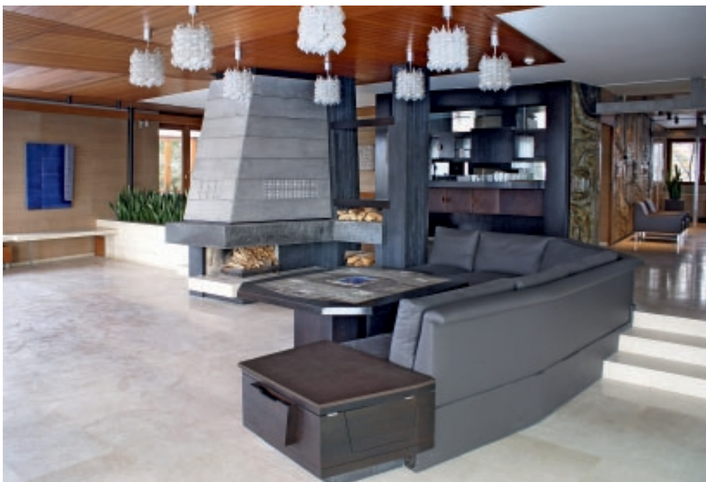
1 Der farbliche Dreiklang im Salon: das helle Honigbraun von Ulmentäfer und Grastapeten an den Wänden, das Rotbraun von Teakrahmen und Holzdecke, das Schwarzbraun von Wenge an Bar, Gaderobe und „Bedienungszentrale“ neben der grauen Ledergarnitur.