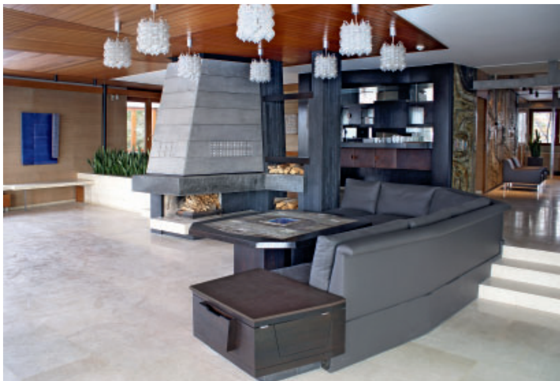
1 Der farbliche Dreiklang im Salon: das helle Honigbraun von Ulmentäfer und Grastapeten an den Wänden, das Rotbraun von Teakrahmen und Holzdecke, das Schwarzbraun von Wenge an Bar, Gaderobe und „Bedienungszentrale“ neben der grauen Ledergarnitur.